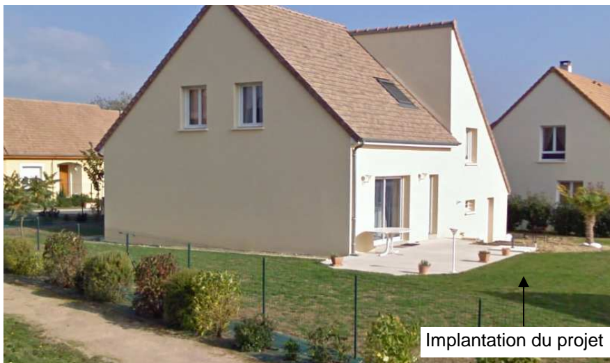
Implantation du projet

La photographie doit être de bonne qualité et si possible en couleur .